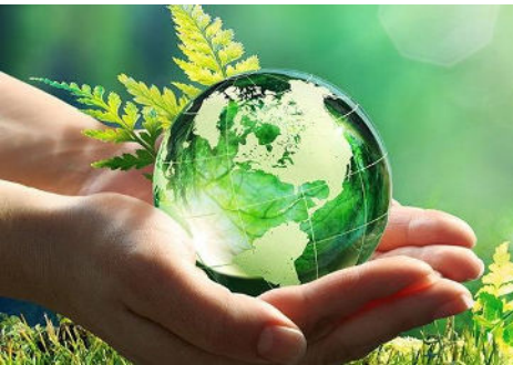
Blog „ Nachhaltige Zukunft “