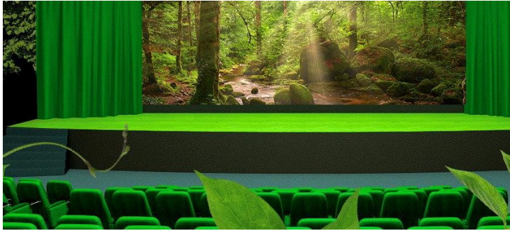
Blog „ Green Cinema “